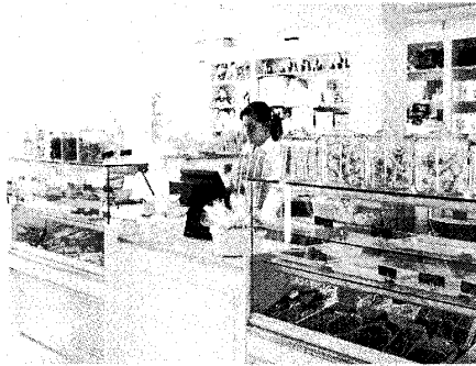
Espacios de Baby Daly: jardín interior para jugar, espacio para actividades y tienda para comprar los productos naturales

TEXTO: MARTA BARROSO Y TERESA DE LA CIERVA